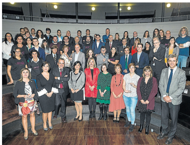
Foto de familia con ganadores y accésits.

La entrega de los Premios Tercer Milenio y la celebración del 25 aniversario del suplemento de ciencia de HERALDO reunieron el pasado jueves en el Paraninfo al ecosistema divulgador, investigador e innovador aragonés. Ganadores y accésits recibieron el aplauso de todos